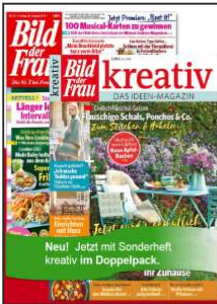
BILD der FRAU Bundle

Ausgabe 35/18 EVT: Freitag, 24. August 2018 Preis: 2,70 Euro