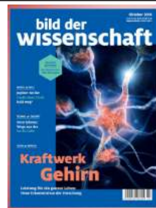
Bild der Wissenschaft Große Relaunch moderner, klarer und frischer! EVT : 18.09.18 VDZ Nr: 02164

Bitte in VOLL SICHT neben happinez platzieren!