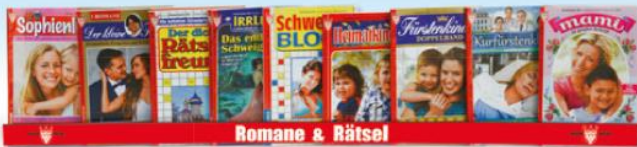
Romane & Rätsel