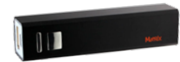
Externer, mobiler Akku für Handy, Laptop usw.

Power Bank gratis bei Abnahme von 2 Beuteln Matrix Volumentabak 140g